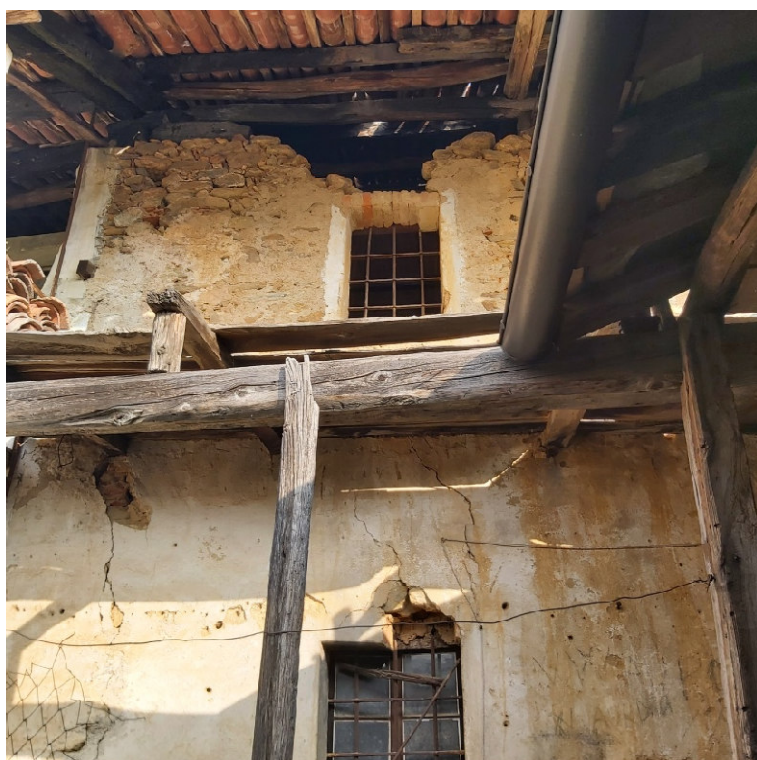
Blocco A P1 su strada P1 e P2