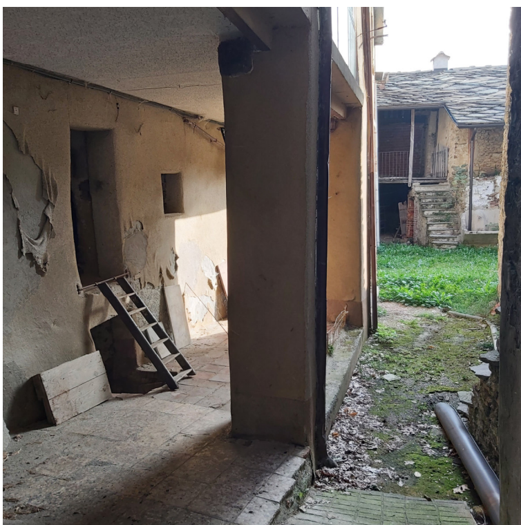
Porticato Blocco B, sullo sfondo la porzione Blocco A su cortile