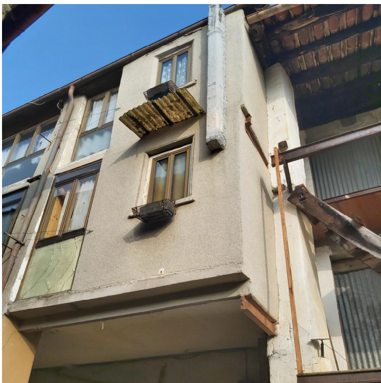
Blocco B superfetazioni da demolire