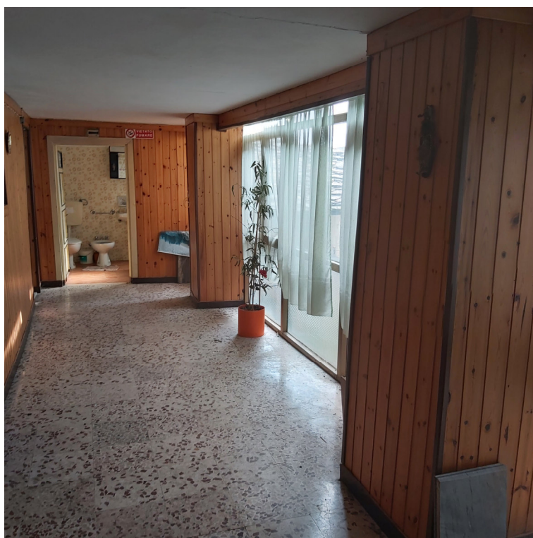
Blocco B P1 ballatoio verandato