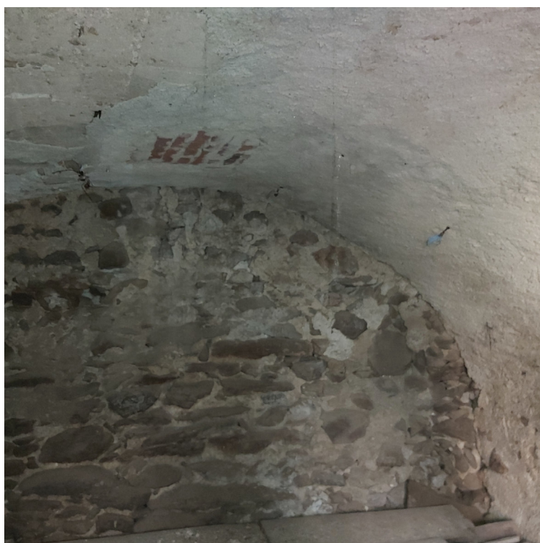
Porzione su cortile PT – prima stanza voltata Blocco A