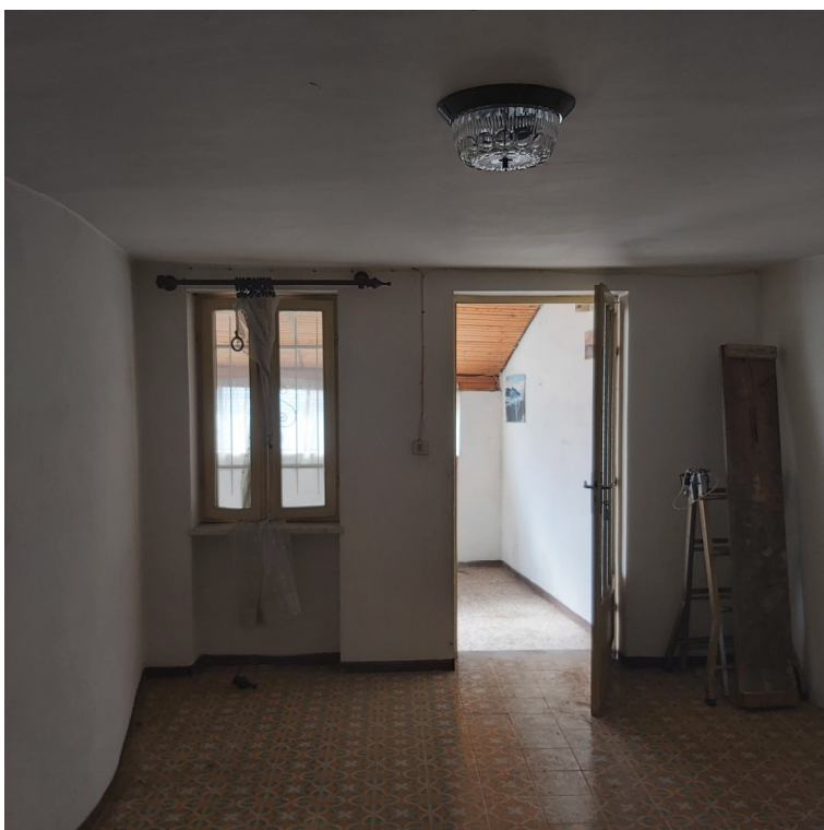
Blocco B P2 camera in corrispondenza dell'androne