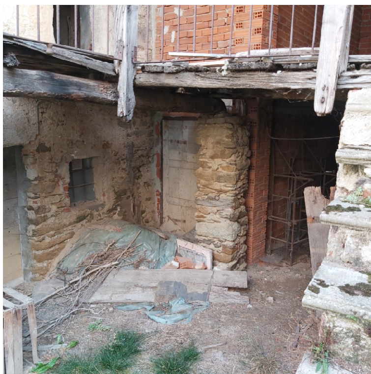
Blocco A, ballatoio distribuzione