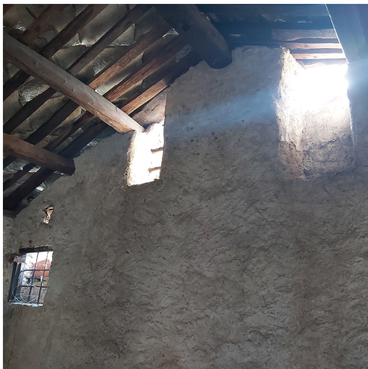
Blocco A P1 su cortile