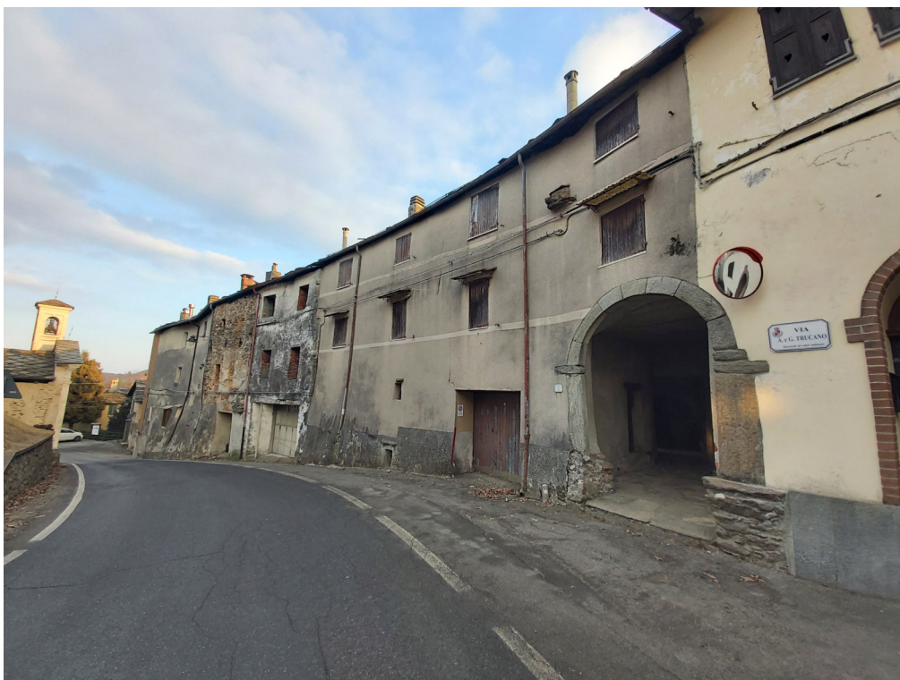
Prospetto su strada (Blocco B in evidenza – Blocco A sullo sfondo)