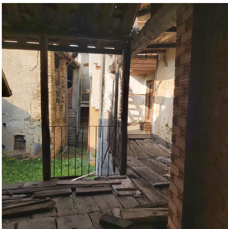
Blocco A P1 su strada - ballatoio