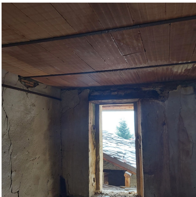
Blocco A su strada P2