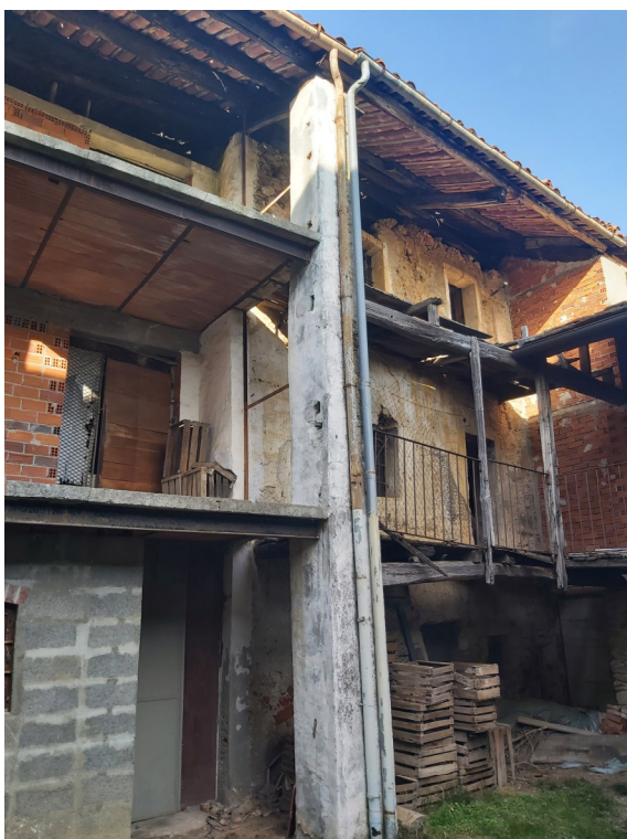
Porzione (intonacata) su strada Blocco A