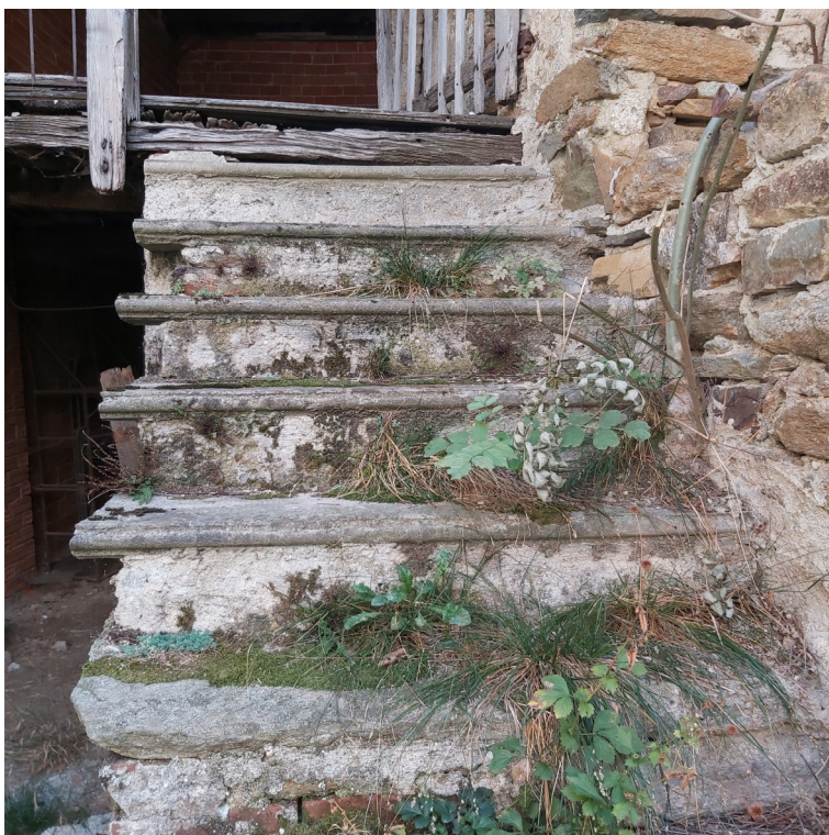
Blocco A, accesso al P1