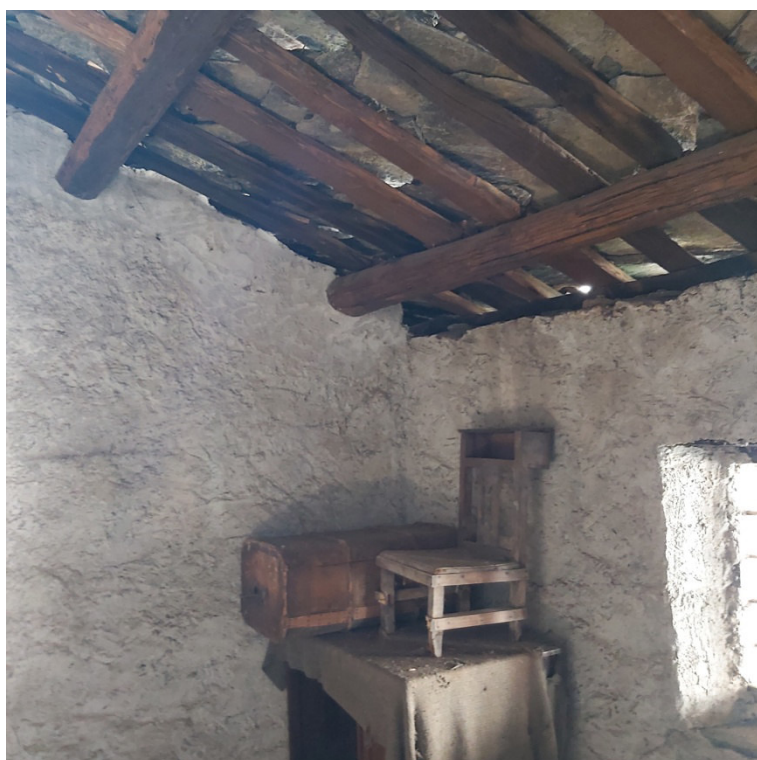
Blocco A P1 su cortile