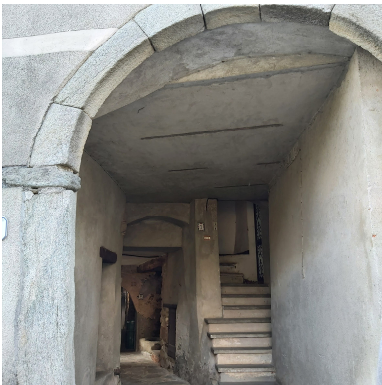
Androne di ingresso (Blocco B)