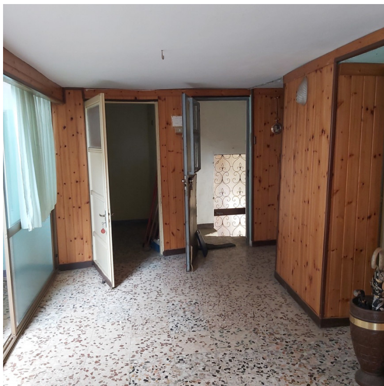
Blocco B P1 ingresso dalla scala su ballatoio verandato