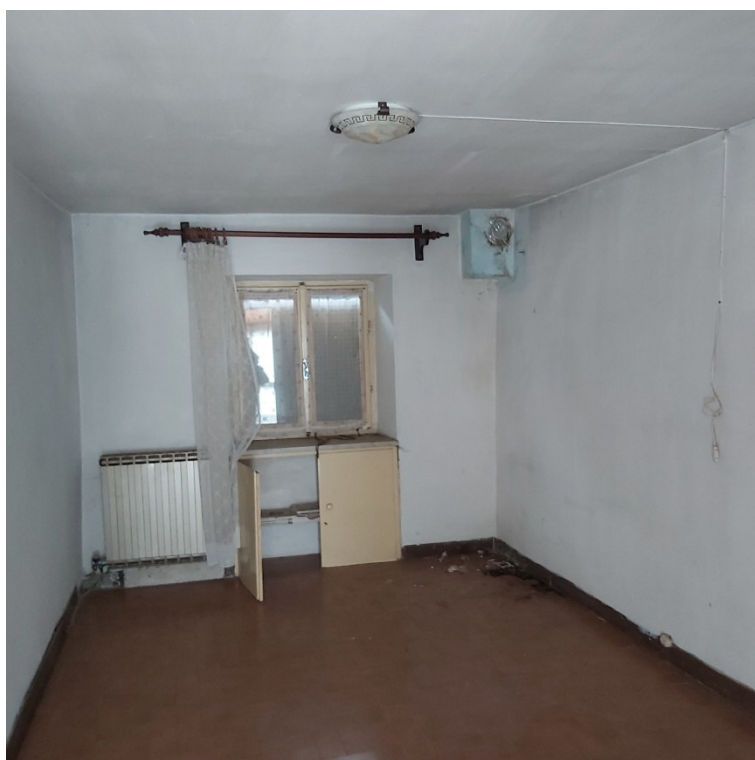
Blocco B P2 camera vicino al WC