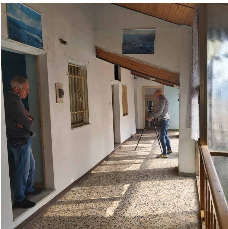
Blocco B P2 ballatoio verandato