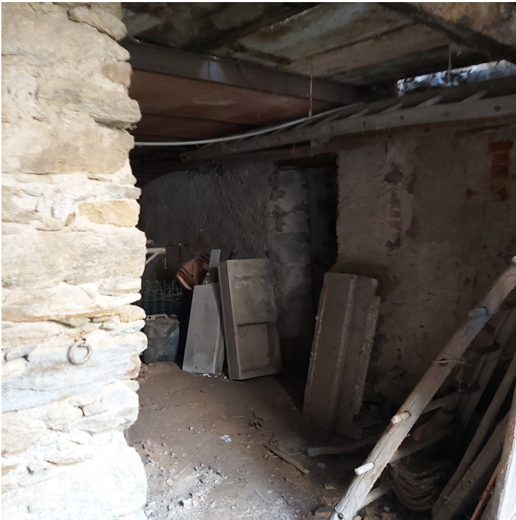
Porzione su cortile ingresso 2° stanza voltata Blocco A