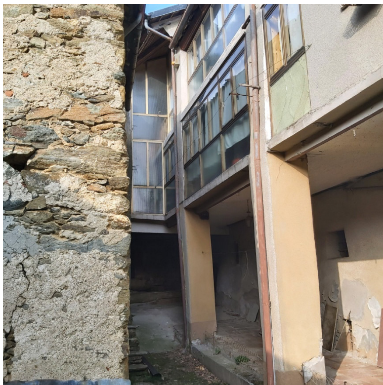
Blocco B prospetto su cortile