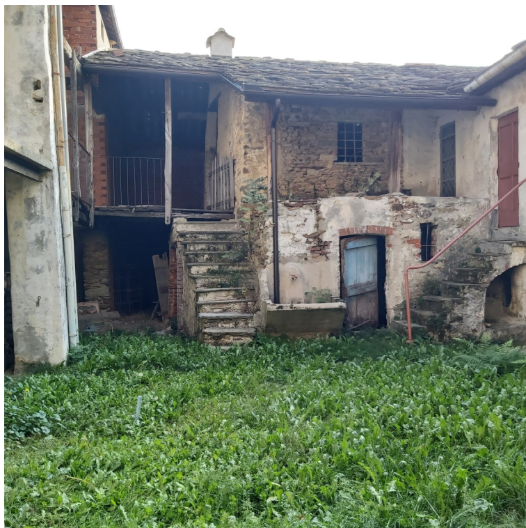
Porzione su cortile Blocco A