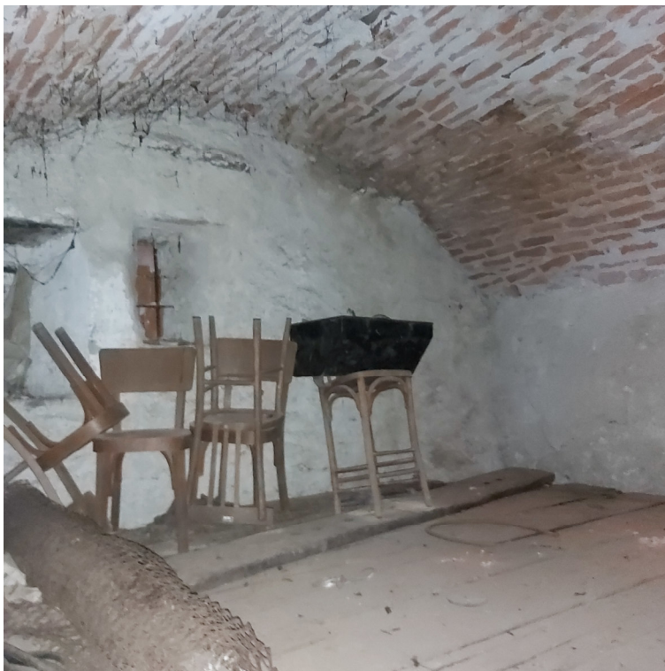
Porzione su cortile 2° stanza voltata Blocco A